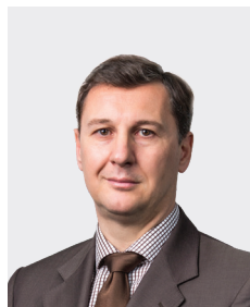
Henri Calvet អភិបាលឯករាជ្យ