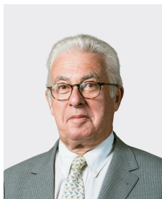
Guy Quaden អភិបាលឯករាជ្យ