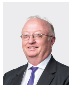
Etienne Chenevier អភិបាលឯករាជ្យ