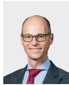
Lionel Pimpin អភិបាលមិនប្រតិបត្តិ