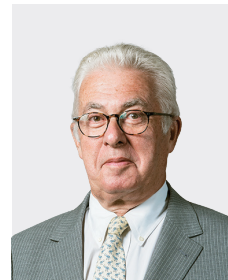
Guy Quaden អភិបាលឯករាជ្យ