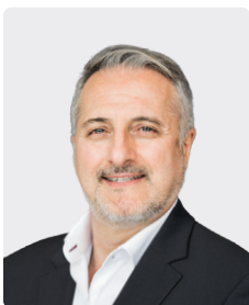
Paolo Pizzuto អភិបាលមិនប្រតិបត្តិ