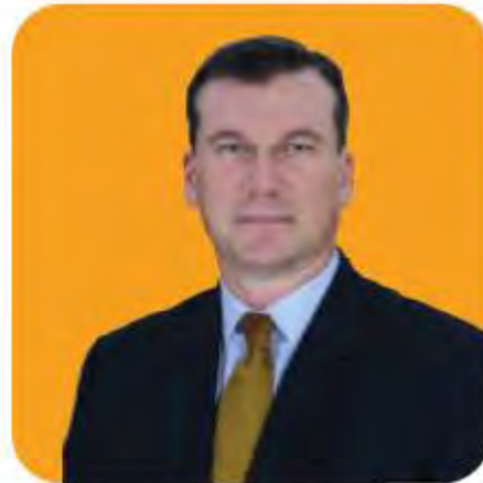
លោក PAUL CAREY CLEMENTS អភិបាលមិនប្រតិបត្តិ