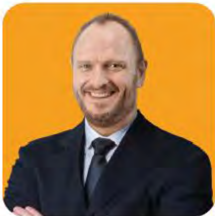
លោក CHRISTOPHER DONALD TIFFIN អភិបាលមិនប្រតិបត្តិ