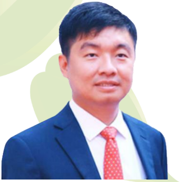
លោក សុខ ពិសិដ្ឋ អភិបាលមិនប្រតិបត្តិ