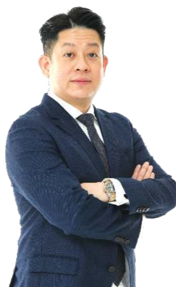
DATO' YAP TING CHIAT អភិបាលប្រតិបត្តិ