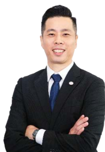
លោក YAP TENG WUI អភិបាលមិនប្រតិបត្តិ