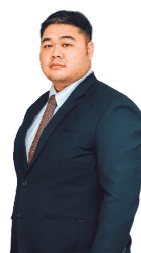
លោក តាន់ សែនាយ អភិបាលឯករាជ្យ