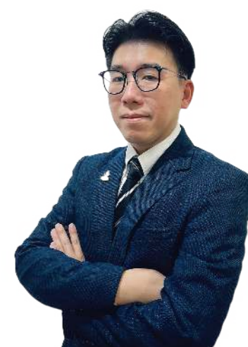
DATO' TAN TECK ZIN អភិបាលឯករាជ្យ