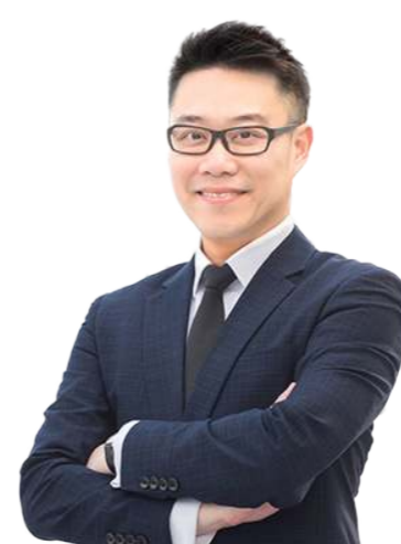
លោក TANG CHAT TONG អភិបាលមិនប្រតិបត្តិ