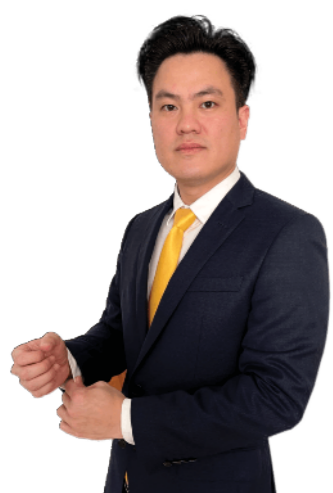
លោកឧកញ៉ា ម៉ង់ លី អភិបាលមិនប្រតិបត្តិ