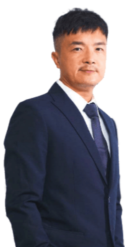
លោក TANG CHUN KIU អភិបាលមិនប្រតិបត្តិ