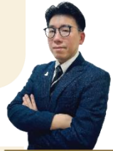
DATO' TAN TECK ZIN អភិបាលឯករាជ្យ