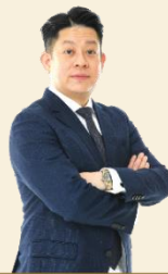
DATO' YAP TING CHIAT អភិបាលប្រតិបត្តិ