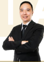
លោក YAP MAOW JUN អភិបាលមិនប្រតិបត្តិ