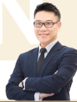
លោក TANG CHAT TONG អភិបាលមិនប្រតិបត្តិ