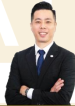
លោក YAP TENG WUI អភិបាលមិនប្រតិបត្តិ