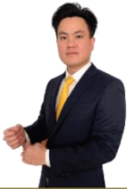
លោកឧកញ៉ា ម៉ឹង លី អភិបាលមិនប្រតិបត្តិ