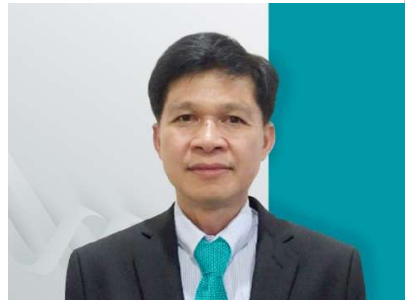
លោក ប៉ាក សេរីវឌ្ឍនា អភិបាលឯករាជ្យ