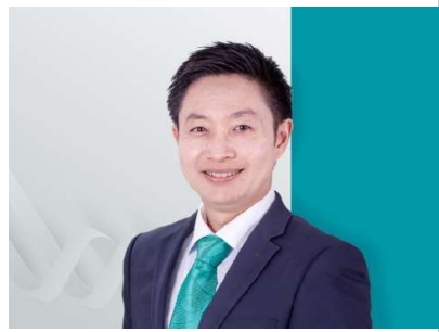
លោក Wanchairabin JITWATTANATAM អភិបាល