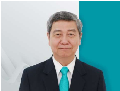
លោក ឡុយ ហៃ អភិបាលឯករាជ្យ