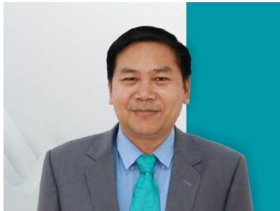
លោក ឌី ជាវុឌ្ឍ អភិបាលឯករាជ្យ