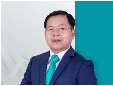
លោក Duangdao WONGPANITKRIT អភិបាល